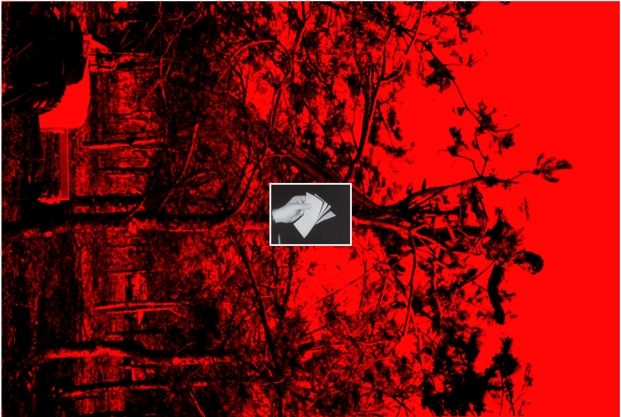
fig. 01 Récolte de cônes à l'aide d'une plate-forme mobile aux Pays-Bas (R.B.L. De Dorschkamp, Wageningen), Guide de manipulation des semences forestières , 1992, archive FAO – fig 02 Emballage de papier carton, Continental Paper Company, 1 er janvier 1954, archive INA

«SAIS-TU COMBIEN DE LIVRES ON PUBLIAIT DANS CE PAYS, IL N’Y A PAS TELLEMENT DE TEMPS, QUAND IL Y AVAIT DU PAPIER, DES PRESSES, DES MACHINES ET DU COURANT?» Extrait du film d’anticipation Soleil Vert , réalisé par Richard Fleischer en 1973